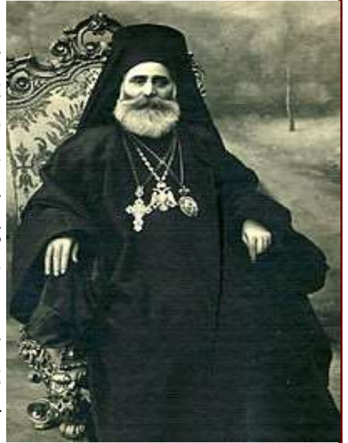
Ο Οικουμενικός Πατριάρχης Μελέτιος

Στα έγγραφα της ίδιας περιόδου υπάρχει με ημερομηνία πρωτοκόλλησης στην ΚτΕ την 29 Νοεμβρίου 1922 τηλεγράφημα από τον Υπουργό Περίθαλψης της Ελλάδος Δοξιάδη προς το Οικουμενικό Πατριαρχείο. Το περιεχόμενο του τηλεγραφήματος σε αγγλική γλώσσα, σε μετάφραση είναι: ΑΜΕΡΙΚΑΝΙΚΟ ΠΟΛΕΜΙΚΟ ΠΛΟΙΟ ΔΙΑΤΑΧΘΗΚΕ ΝΑ ΜΕΤΑΒΕΛΙ ΣΤΗΝ ΜΕΡΣΙΝΑ stop ΝΑ ΜΕΤΑΦΕΡΕΙ 5.000 ΠΡΟΣΦΥΓΕΣ ΠΟΥ ΕΙΝΑΙ ΣΥΓΚΕΝΤΡΩΜΕΝΟΙ ΕΚΕΙ stop ΖΗΤΗΘΗΚΕ ΑΠΟ ΤΟΝ ΝΑΥΑΡΧΟ BRISTOL (ΗΠΑ) ΝΑ ΔΙΑΘΕΣΕΙ ΠΟΛΕΜΙΚΑ ΠΛΟΙΑ ΓΙΑ ΝΑ ΣΥΝΟΔΕΥΣΟΥΝ ΤΑ ΠΛΟΙΑ ΠΟΥ ΘΑ ΠΑΡΑΛΑΒΟΥΝ ΚΑΤΟΙΚΟΥΣ ΑΠΟ ΤΑ ΠΑΡΑΛΙΑ ΤΗΣ ΜΑΥΡΗΣ ΘΑΛΑΣΣΑΣ stop ΕΙΝΑΙ ΑΝΑΓΚΗ ΝΑ ΠΡΟΒΕΙΤΕ ΣΕ ΕΝΕΡΓΕΙΕΣ ΠΡΟΣ ΤΙΣ ΣΥΜΜΑΧΙΚΕΣ ΑΡΧΕΣ ΓΙΑ ΝΑ ΕΠΙΤΡΑΠΕΙ Η ΔΙΕΛΕΥΣΗ ΤΩΝ ΑΜΕΡΙΚΑΝΙΚΩΝ ΠΛΟΙΩΝ ΑΠΟ ΤΟΝ ΒΟΣΠΟΡΟ ΕΠΕΙΔΗ ΑΦΟΡΑ ΖΗΤΗΜΑ ΔΙΕΘΝΕΣ ΚΑΙ ΑΥΤΟ ΠΡΕΠΕΙ ΝΑ ΓΙΝΕΙ ΠΡΙΝ ΞΕΚΙΝΗΣΟΥΝ ΤΑ ΠΛΟΙΑ ΑΠΟ ΕΔΩ (ΕΛΛΑΔΑ) stop ΤΗΛΕΓΡΑΦΗΣΤΕ ΤΗΝ ΛΗΨΗ ΤΗΣ ΑΔΕΙΑΣ ΩΣΤΕ ΝΑ ΞΕΚΙΝΗΣΟΥΝ ΤΑ ΠΛΟΙΑ ΑΠΟ ΕΔΩ.