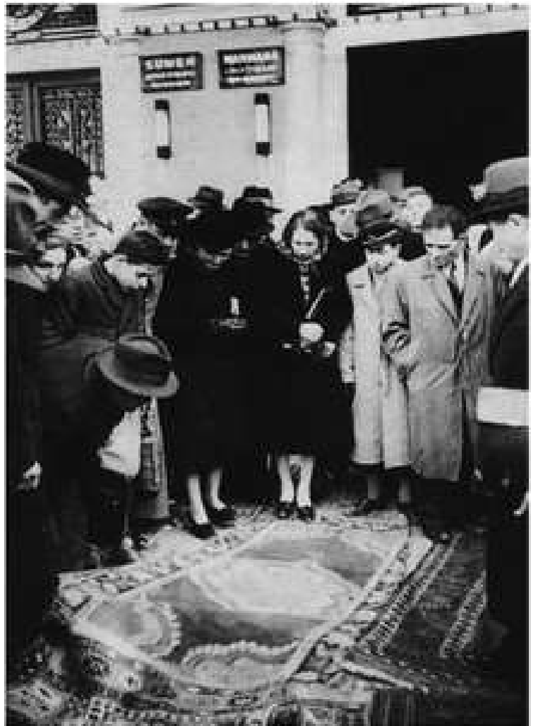
Εκποίηση της οικοσκευής σε σίτι μη-Μουσουλμάνου που έχει υποστεί τον Φόρο.

Στην εισαγωγή του κεφαλαίου αναφέρονται τα εξής: ο φόρος βαρλικ βεργκισι που εφαρμόστηκε μετά από την ψήφισή του την 11η Νοεμβρίου 1942 από την Μ. Εθνοσυνέλευση της Τουρκίας είναι σημαντικό να εξεταστεί ότι μόνο από οικονομικής πλευράς αλλά ως ένα πολιτικό και πολιτισμικό γεγονός κατά την εφαρμογή του. Ο τρόπος που ψηφίστηκε από την Εθνοσυνέλευση, συστηματικός τρόπος υποστήριξης του από τον κατευθυνόμενο της εποχής, ο τρόπος της λειτουργίας των επιτροπών που αποφάσιζαν πόσο φόρο θα πληρώσει ο καθένας, η δημοσίευση των οφειλετών και τα ποσά που οφείλουν, η κατάσχεση των περιουσιακών στοιχείων αυτών που δεν πλήρωναν την οφειλή τους και η εκποίηση των περιουσιών τους, όταν θα έφθανε το ποσό που προέκυπτε από τις κατασχέσεις και την εκποίησή τους το πως αυτά θα εξοφλούσαν με σωματική εργασία την οφειλή τους με την οδήγησή τους σε στρατόπεδα εργασίας, όλα αυτά δείχνουν τους μηχανισμούς λειτουργίας και της άσκησης των αντιμειονοτικών πολιτικών από το μονοκομματικό καθεστώς του Λαϊκού Ρεπουμπλικανικού Κόμματος. Η προσεκτική μελέτη της προετοιμασίας για την επιβολή αυτό του σκληρού αντιμειονοτικού μέτρου φαίνεται από διάφορες δηλώσεις του Κεμαλικού καθεστώτος που μετά από την διαδοχή στην Προεδρία της χώρας από τον Ισμέτ Ινονού έχει τον τίτλο του Εθνικού Ηγέτη – Milli Şef.