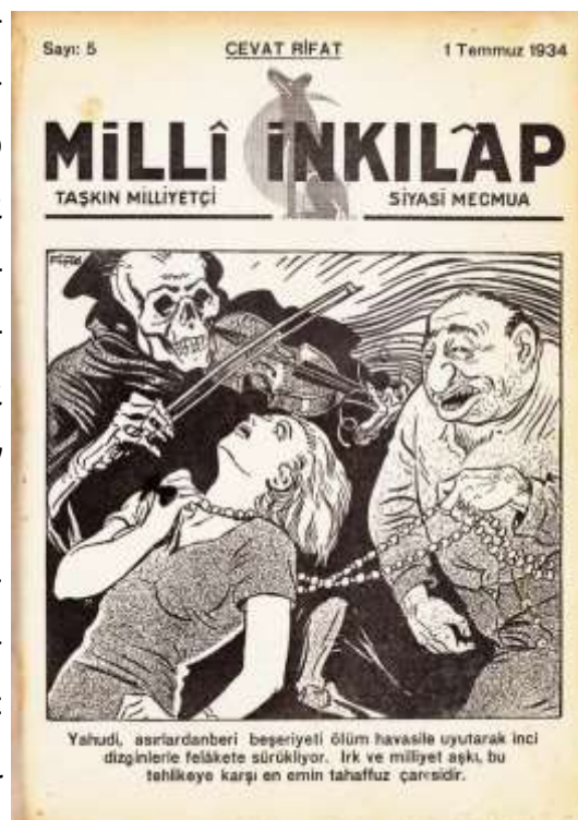
Αντισημιτικό περιοδικό που κυκλοφόρησε την 1/7/1934