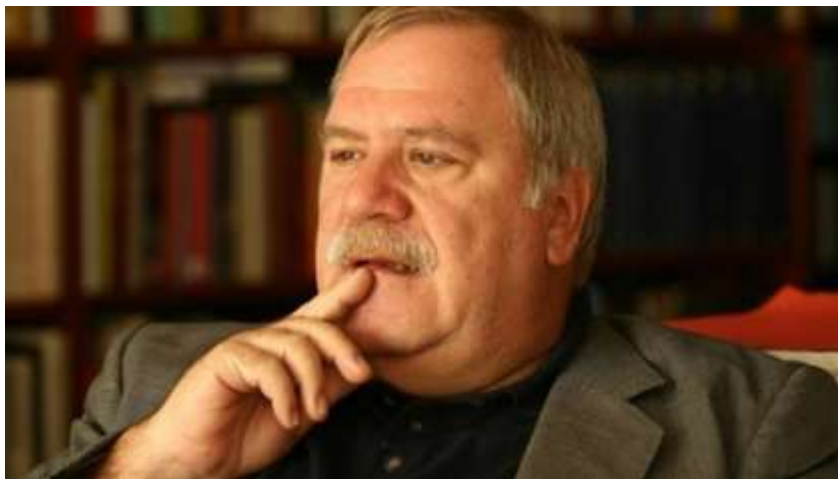
Ο συγγραφέας του βιβλίου καθ. Ayhan Aktar

απαγορεύτηκε σύντομα. Παράλληλα από πολλούς αρθρογράφους εφημερίδων ο Faik Ökte μετά από την δημοσίευση του βιβλίου του χαρακτηρίστηκε εθνικός προδότης παρόλο που ο ίδιος ανέφερε στον πρόλογο του βιβλίου του ότι σκοπός του είναι να συμβάλλει να μην συμβούν ξανά τέτοιες αδικίες στην Τουρκία. Όπως αναφέρεται στο 8ο κεφάλαιο του βιβλίου ο Ayhan