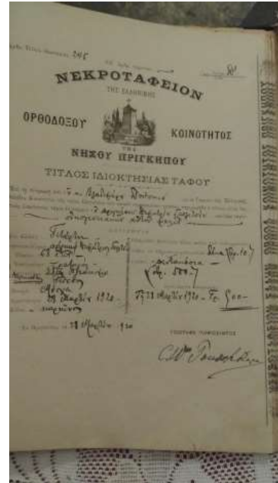
Δ.11.8 ΠΡΙΓΚΙΠΑΣ ΡΩΣΙΑΣ ΓΚΟΛΟΤΣΙΝ ΔΗΜΗΤΡΙΟΣ